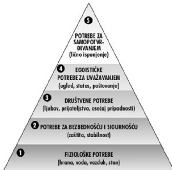
Figure 1. Maslow's hierarchy of needs

https://teorijamotiva.wordpress.com/2015/05/11/hijerarhija-motiva/