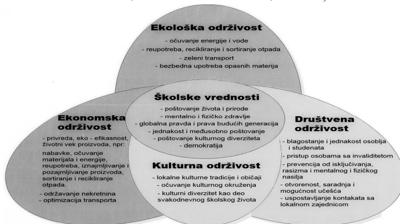
Слика 2. Елементи одрживог развоја у школи (модификовано из Laininen, Manninen and Tehnunen, 2006: 10)

Генерално, образовање представља централну тему у различитим глобалним дебатама које се тичу промовисања промена и понашања, као и начина живота у циљу постизања одрживог развоја. С обзиром на то, веза између образовања, инклузивног друштва и одрживог развоја јесте интринзично повезана. Основни принципи ових концепата теже да повежу образовање са ширим низом питања, као и да прате нове инструменте за усклађивање образовног развоја и решавања питања социјалне неједнакости (Rambla and Langthaler, 2016). У том смислу, образовање се посматра као алат за промовисање правде и једнакости, али и има значајну улогу и у обликовању вредности будућих генерација, преусмеравању будућих преференција у вези са различитим питањима и (Vladimirova and Le Blanc, 2015). Поред тога, оно може да преобликује људске системе вредности тако да они буду у могућности да подрже и унапреде принципе одрживог развоја. образовање омогућава људима да разумеју демократију и промовише толеранцију и поверење. У вези са тим, УНЕСЦО примећује да је образовање често фрагментирано и да није у могућности да допринесе одрживом друштву и одрживом развоју. С обзиром на то, веза између образовања и одрживог развоја треба даље истраживати и трансформисати постојеће образовне програме у више инклузивне и одрживије и (UNESCO, 2017). Другим речима, потребно је инкорпорирати вредности еколошке, економске, друштвене и културне одрживости у школске објекте. На Слици 2. су приказани елементи одрживог развоја у школи.