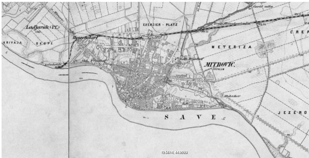
Карта3. Трећи Аустроугарски премер (1869-1887) Митровица (1:25000)