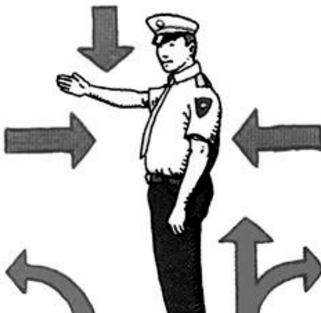
Слика 00. Хрватски прометник „постао” српски саобраћајац.