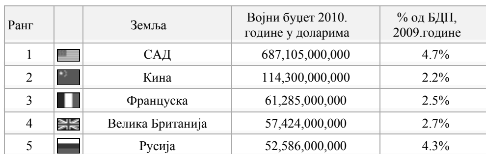
Табела 1.- Преглед првих пет земаља према висини војног буџета у 2010. години и процентом учешћа у бруто друштвеном производу (Р. Стојановић, 1982: 78-79)

Сједињене Америчке Државе не само што су највећа економска сила (највећи БДП на свету) већ убедљиво имају и највећи војни буџет на свету. Одмах после САД, према висини војног буџета, налазе се управо преостале четири сталне чланице Савета безбедности УН: Кина, Француска, Велика Британија и Русија, како је приказано у табели 1 и графикону 1. Управо ових пет земаља носе и највећу одговорност за стање глобалне безбедности у свету.