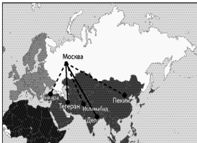
Извор: (А. Дугин, 2011: 497)